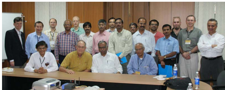
2006-11-23, IISc - Bangalore