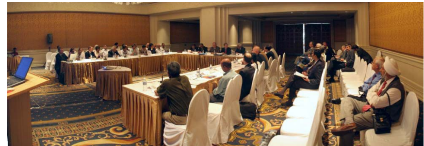
2006-11-22, Bangalore - Atelier Québec-Inde (NAL et IISc)